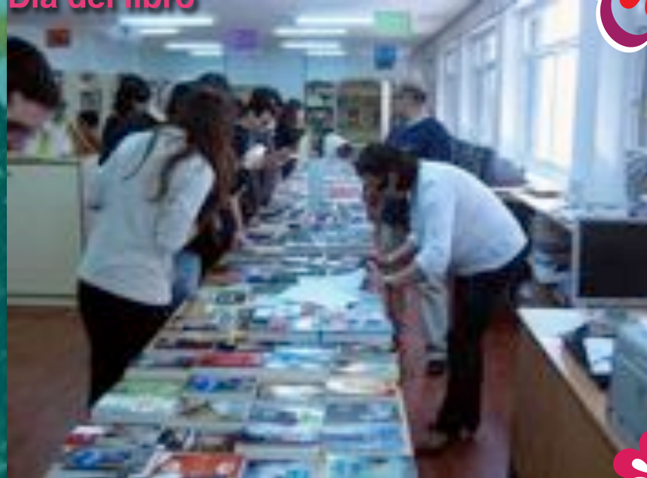
Feria del libro con sustanciosos descuentos.