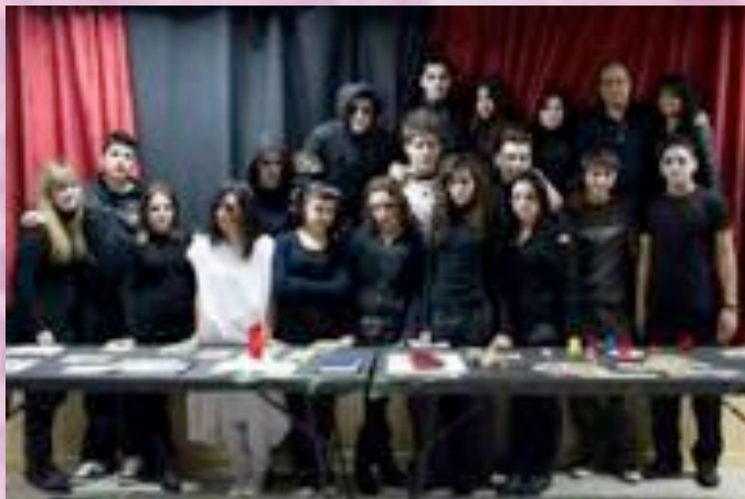
El magnífico equipo de colaboradores caracterizados para dar vida a la exposición "De occultis libris".

Reiteramos nuestro agradecimiento al Ayuntamiento, y en concreto a la Concejalía de Educación y Cultura, por su colaboración.