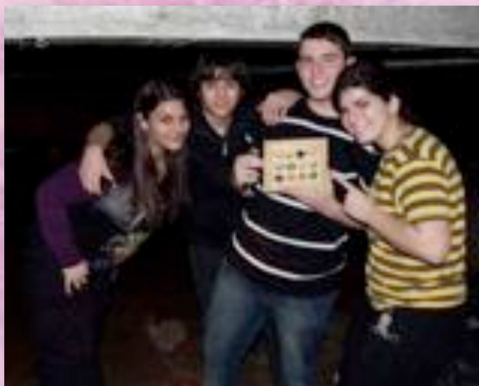
Parte del equipo ganador de "La búsqueda del Efad", posa orgulloso después de encontrar el ansiado Efad.