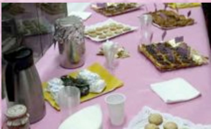
Una muestra de los productos elaborados por empresas gestionadas por mujeres.