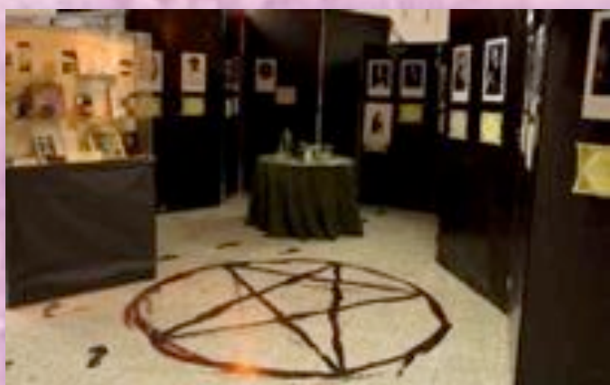
Una vista de la exposición "De occultis libris".