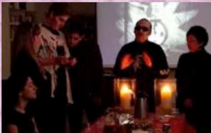
Un momento del "Desayuno terrorífico"