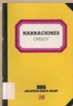
Narraciones de Chejov Edit. Salvat

Diez cortos relatos, escritos a vuelapluma, que encierra el germen de la genialidad de este autor.