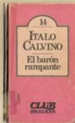
El barón rampante de Italo Calvino edit. Bruguera

Este relato es en gran parte una autobiografía de su amarga experiencia en el extranjero y de su extraordinaria pasión por el juego que le llevó hasta la ruina económica.