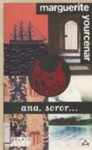
Ana, soror... de Marguerite Yourcenar Edit. Aguilar

Diez cortos relatos, escritos a vuelapluma, que encierra el germen de la genialidad de este autor.