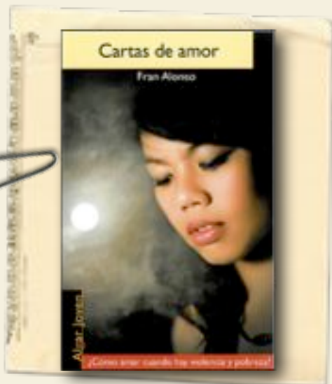
FRAN ALONSO Cartas de amor Ed. Algar

Cartas de amor escritas por mujeres que viven circunstancias vitales o personales que afrontan con valentía.